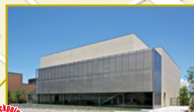
谷口吉郎・吉生記念 金沢建築館