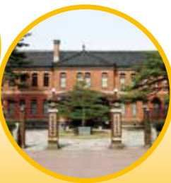
石川四高記念文化交流館 (石川近代文学館)