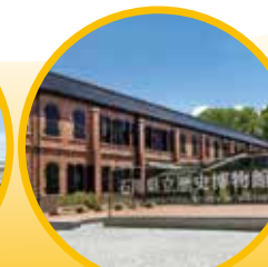
石川県立歴史博物館