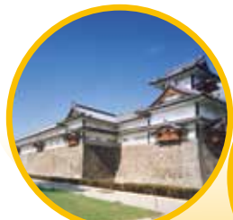
金沢城公園 菱櫓・五十間長屋・ 橋爪門・続櫓・橋爪門