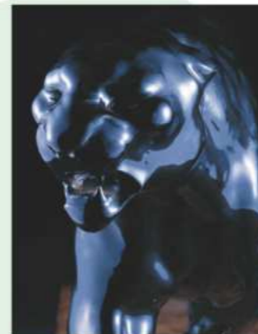
小川雄平(陶製黒豹置物)(部分)1933年 国立工芸館蔵