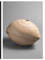
松永圭太氏《蛭》 2024年作家蔵