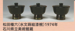
松田権六(水文時絵漆碗)1974年 石川県立美術館蔵

食と工芸をめぐる石川の歴史と文化の厚みを発信。第1部では、石川の食と季節の行事を象徴する工芸作品を紹介します。第2部では、国内外で活躍する県内在住の気鋭の工芸作家による、食をテーマにした新作の共演をお楽しみいただけます。 観覧料：1,000円(一般)ほか