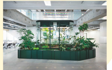
Fabbrica dell'Aria® PNAT 2023