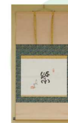
宝生九郎重英 筆「千秋楽」 昭和時代・20世紀