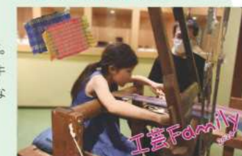
この夏は、家族で 工芸体験を楽しもう!