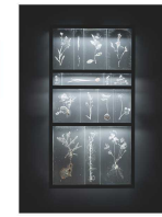
佐々木頼氏《植物の記憶 /うづろい(加月)》 2024年作家蔵

会場：国立工芸館 多目的室 対象：どなたでも 定員：45名・先着順 登壇者：佐々木頼氏(ガラス作家/アーティスト)、松永圭太氏(陶芸作家) ファシリテーター：岩井美恵子(国立工芸館工芸課長、本展企画者)