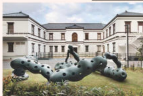
橋本真之「果樹園—果実の中の木もれ陽、木もれ陽の中の果実」1978-88年

国立工芸館の裏庭で強烈な存在感を放つ「果樹園—果実の中の木もれ陽、木もれ陽の中の果実」。光と影をキーワードに、作者の橋本真之氏にお話を伺います。 対象:どなたでも 定員:45名 申込:国立工芸館ウェブサイト (www.momat.go.jp/cg) または同館SNSにてお知らせ 会場:国立工芸館