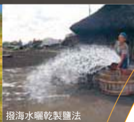
撥海水曬乾製鹽法