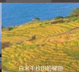
白米千枚田的梯田